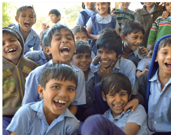
टेबल 6: विद्यालय में शारीरिक शिक्षा और खेल 2018